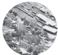
SAIGON | Cathédrale | Agrandissement Mission Oblique RO155 du 07 septembre 1955