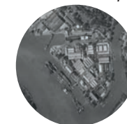
SAIGON | Arsenal | Agrandissement Mission RV6 du 6 janvier 1952 © Service historique de la Défense, Vincennes, Cliché 112.