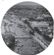
SAIGON | L'Arroyo Chinois | Années 1930

Les fonds de photos aériennes conservés par le Service historique de la Défense sont de riches compléments aux documents cartographiques utilisés par les chercheurs. Le fonds Indochine est en cours de numérisation et sera progressivement mis en ligne sur le portail internet Virtual Saigon.