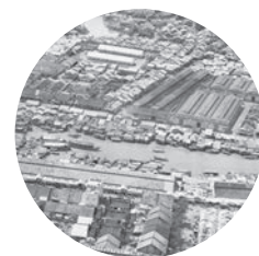
SAIGON | Marché flottant | Mission Oblique RO155 du 07 septembre 1955