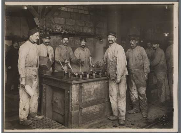
Lyon. Parc d'artillerie de la Mouche. La fusion de la ménéilite. Bibliothèque municipale de Lyon (Res151075_005_0018)