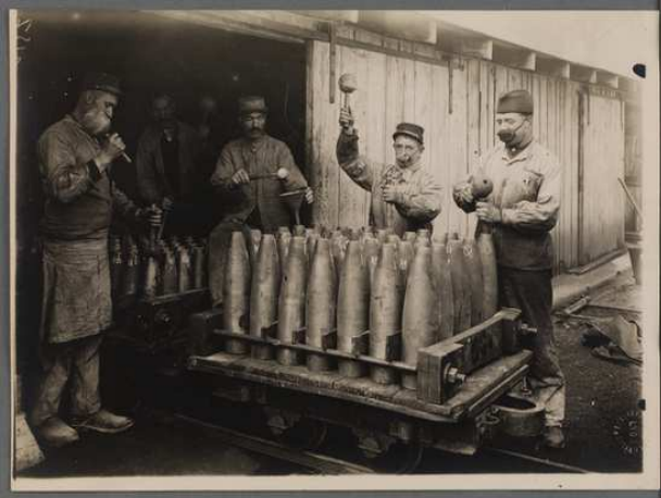
Lyon. Parc d'artillerie de la Mouche. Tassage de la poudre dans les obus. (Res151075_005_0020)