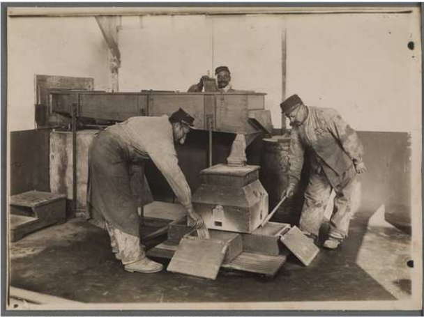
Lyon. Parc d'artillerie de la Mouche. Tamisage de la poudre. (Res151075_005_0021)