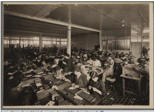
Lyon. Usine de matériel de guerre. Le contrôle des pièces de 75. Bibliothèque municipale de Lyon (Res151075_004_0003)