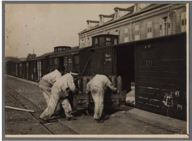
Lyon. Parc d'artillerie de la Mouche. Kabyles poussant un chariot de 155. Bibliothèque municipale de Lyon (Res151075_005_0060)