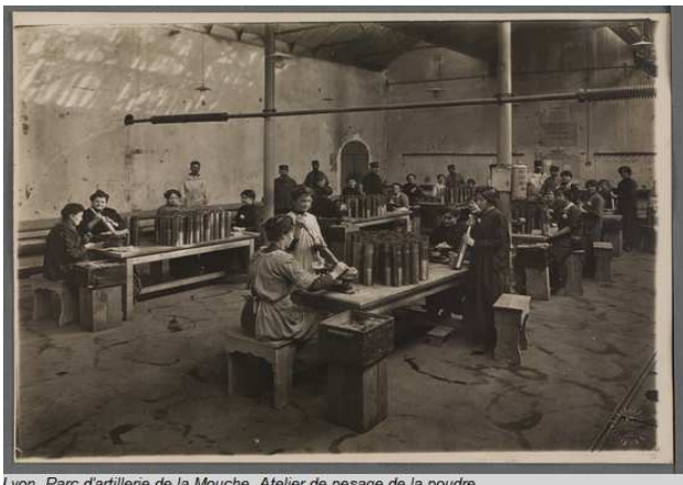
Lyon. Parc d'artillerie de la Mouche. Atelier de pesage de la poudre. Bibliothèque municipale de Lyon (Res151075_005_0028)